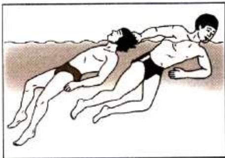
Буксировка тонущего с захватом за волосы