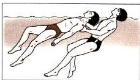
Буксировка тонущего с захватом под мышками

Буксировка с захватом под мышками. Оказывающий помощь крепко подхватывает пострадавшего под мышки и буксирует утопающего, плывя на спине при помощи ног.